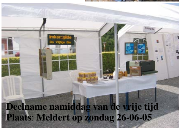
Deelname namiddag van de vrije tijd Plaats: Meldert op zondag 26-06-05