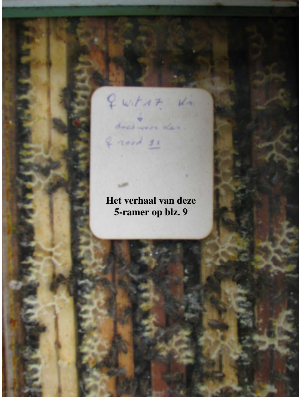
Het verhaal van deze 5-ramer op blz. 9